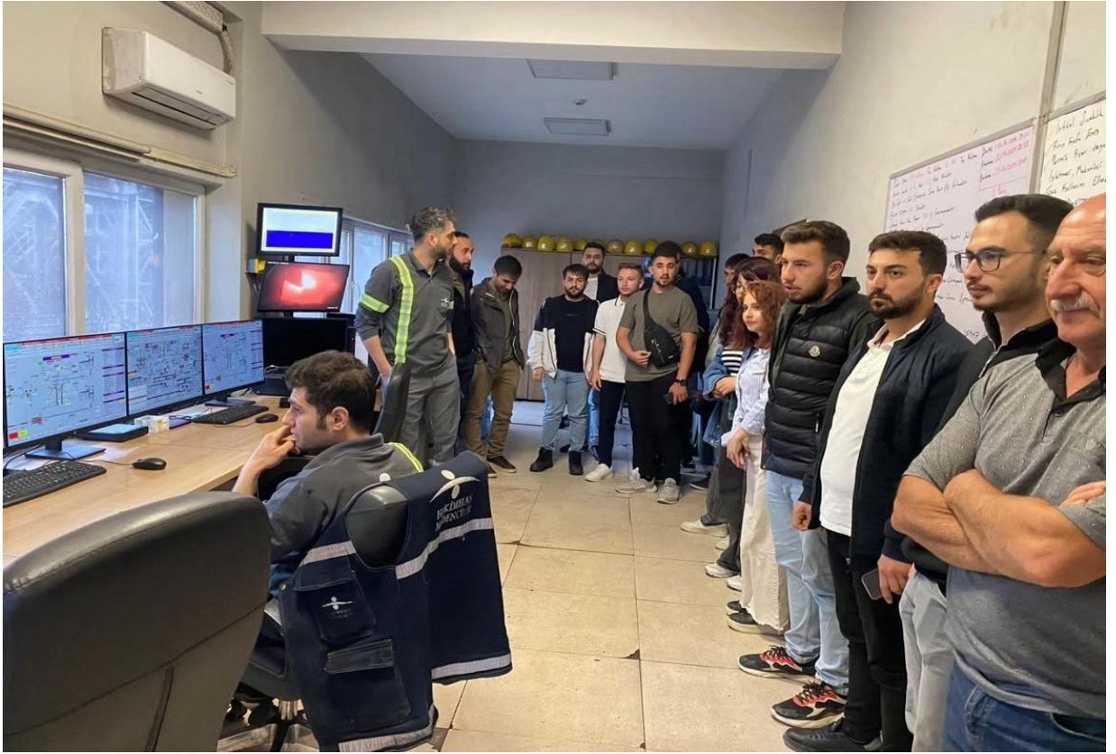
13.05.2025 Hekimhan Madencilik Teknik Gezi