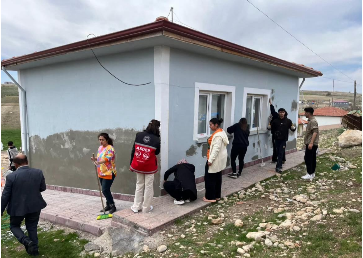
30.04.2025 Ailem ve Okulum Projesi