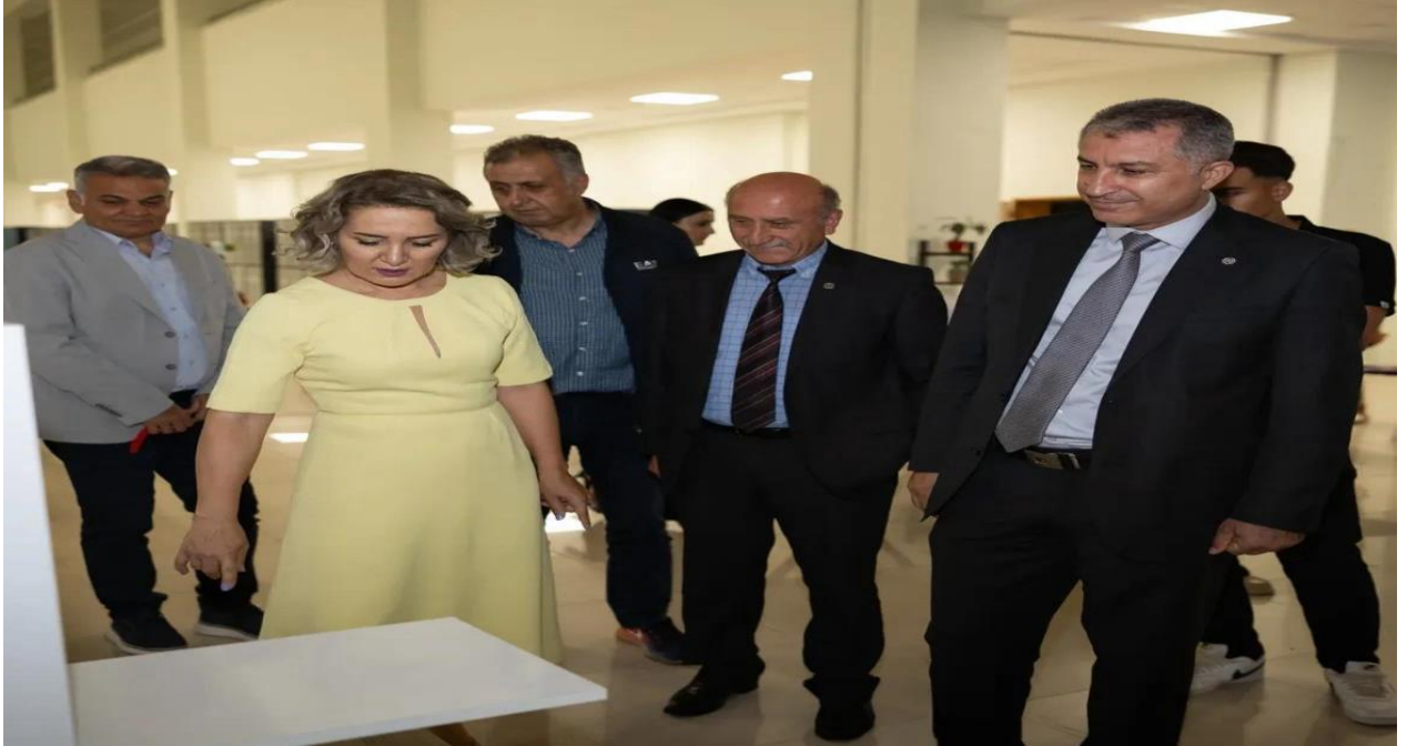
29.05.2025-30.05.2025 Sıra Dışı İşler Mezuniyet Sergisi