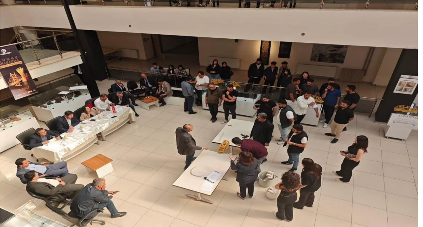
15.05.2025 Çubuk Makarna Köprü Yarışması