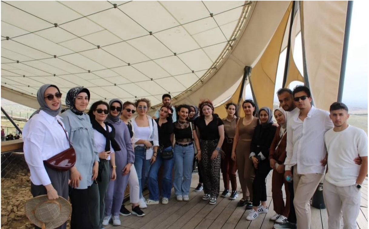
01.05.2025-02.05.2025 Şanlıurfa- Mardin Teknik Gezi