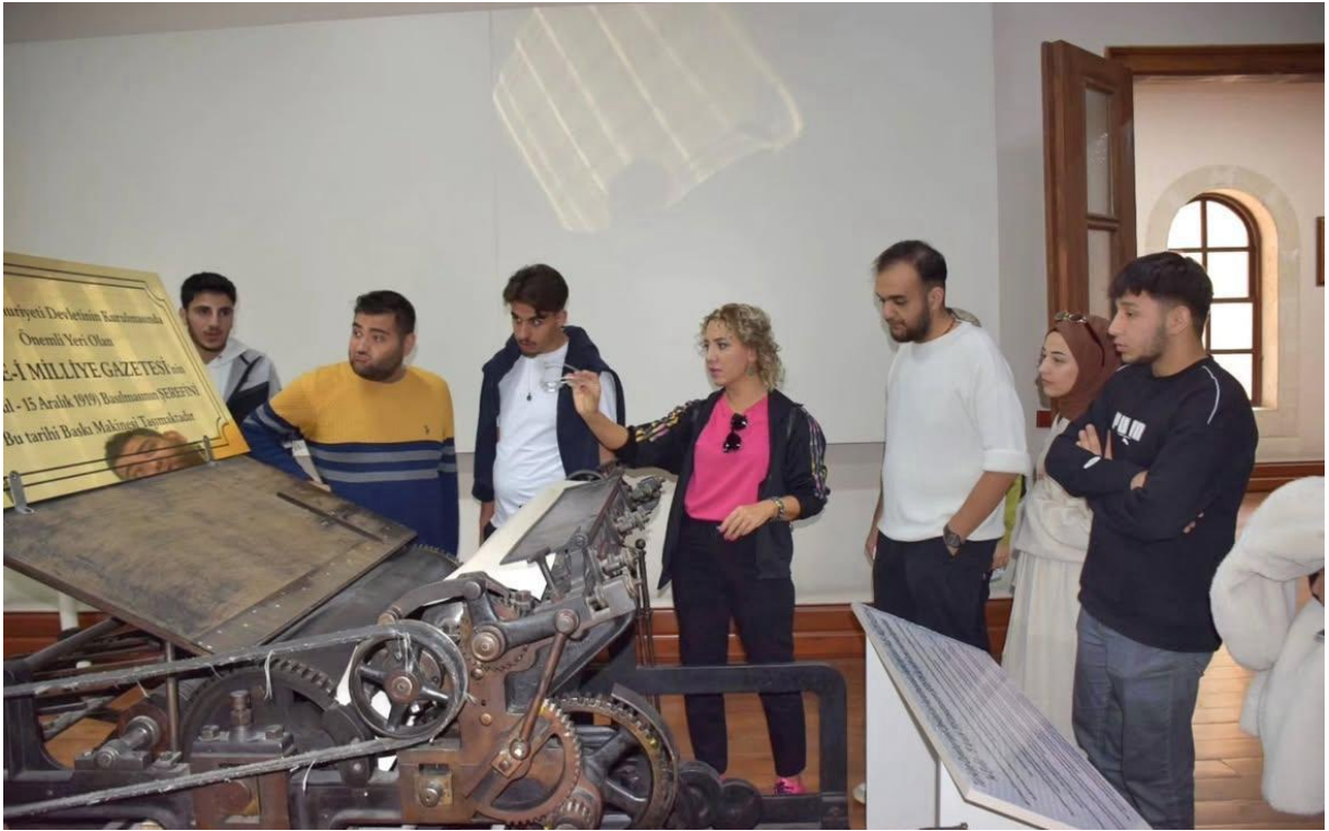
17.10.2025 Sivas Teknik Gezi